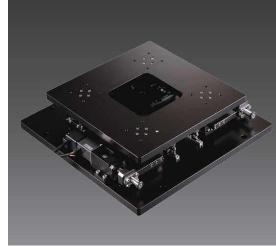
此圖僅供參考，出貨規格詳見尺寸圖面